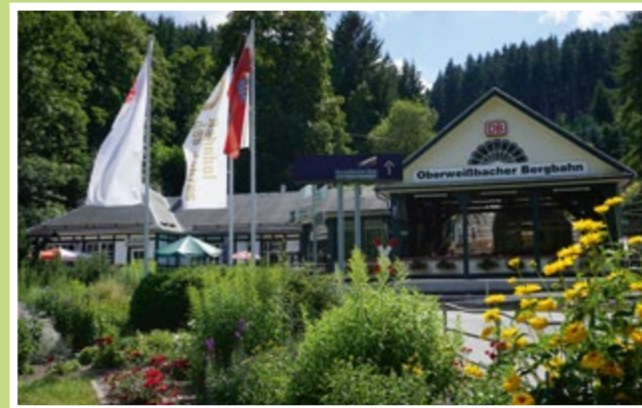
Talstation mit Bergbahnshop