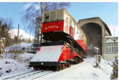
Das ganze Jahr im Einsatz

Auf der Hochebene führt eine 2,6 km lange elektrifizierte Flachstrecke von Lichtenhain über Oberweißbach nach Cursdorf. Hier verkehren zwei historische Triebwagen, weltweit einmalige Unikate aus den 1970er Jahren. Auch unten im Schwarzatal sind Sie mit der Bahn bestens unterwegs: Zwischen Rottenbach und Katzhütte verkehren moderne, klimatisierte Triebwagen .