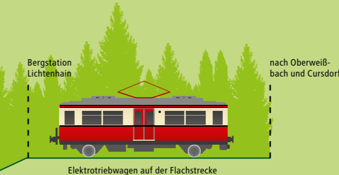
Elektrotriebwagen auf der Flachstrecke

Werfen Sie im Maschinarium einen Blick hinter die Kulissen der Bergbahn und erleben Sie deren Technik interaktiv. Es werden Ihnen an verschiedenen Stationen Funktionsweise, Technik und Besonderheiten der Oberweißbacher Bergbahn spannend erläutert und Mitmachen steht auf dem Programm. Außerdem wird Ihnen ein exklusiver Blick in das Maschinenhaus, dem Herzstück der Bergbahn, gewährt.