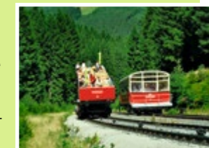
An der Ausweichstelle.

Das Herzstück, die Standseilbahn, wurde ursprünglich zum Transport von Güterwagen vom Tal auf die Hochebene gebaut. Heute ist sie ein touristischer Magnet mit Aussichtsgarantie. Denn mit 25 % Steigung überwindet diese einzigartige Standseilbahn einen Höhenunterschied von 323 m.