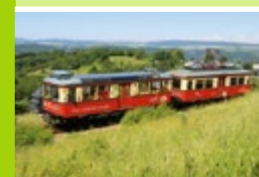
Flachstrecke mit Olitätenwagen

Im Sommerhalbjahr ist Bergbahn fahren „oben ohne“ ein besonderes Highlight. Der Aufsatzwagen auf der Güterbühne wird bei schönem Wetter gegen einen Cabrio-Wagen getauscht.