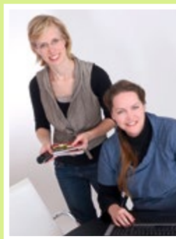
„Handwerk und Kultur erleben“ gestaltet rund um die Bergbahnfahrt Ihren Ausflug ganz individuell nach Ihren Wünschen.

Handwerk und Kultur erleben Lauensteiner Straße 44 96337 Ludwigsstadt Tel. 09263 974543 www.handwerkundkultur.de