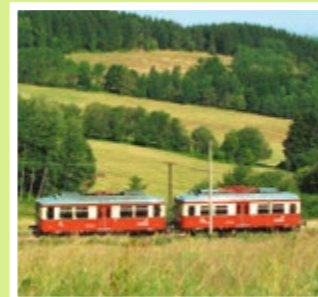
Triebwagen der Flachstrecke