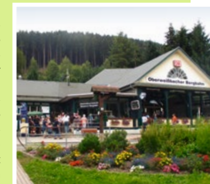
Talstation mit Bergbahnshop

Das Personal des Bergbahnshops betreut Ihre Gruppe von der Anmeldung bis zur Fahrt. Hier erhalten Sie Informationen rund um die Bergbahn, außerdem auch Fahrscheine und Souvenirs. Eine Reservierung Ihrer Gruppe ist empfehlenswert, damit Sie auch zur gewünschten Uhrzeit mit der Bergbahn fahren können.