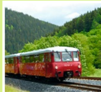
Historischer Triebwagen BR 772

Auch unten im Schwarzatal ist man gut mit der Bahn unterwegs. Zwischen Rottenbach und Katzhütte verkehren moderne, klimatisierte Triebwagen. Die Bahnhöfe und Fahrzeuge der OBS sind für Rollstühle und Kinderwagen geeignet. Seien Sie willkommen!